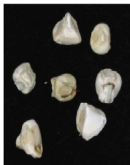
Semillas de teosinte en estadio 83.