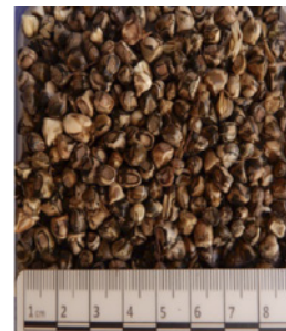
Semillas de teosinte en estadio 89.