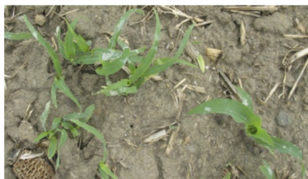
Plántulas de teosinte en los estadios 11 a 14.