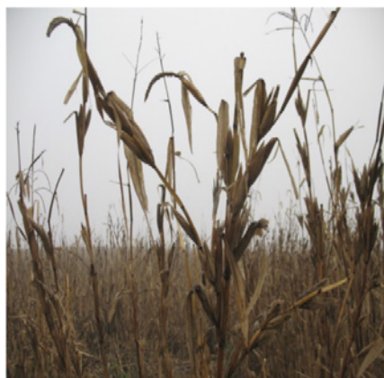
Espigas de teosinte en estadio 99.