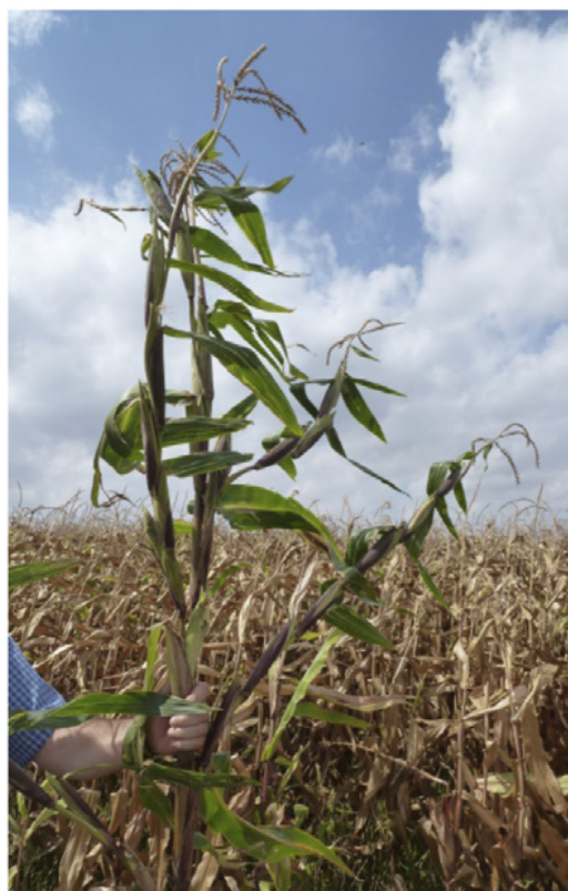
Floración terminada. Planta con 4 o más ramificaciones laterales. Estadio 69.