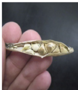
Semillas de teosinte en estadios 83 y 85.