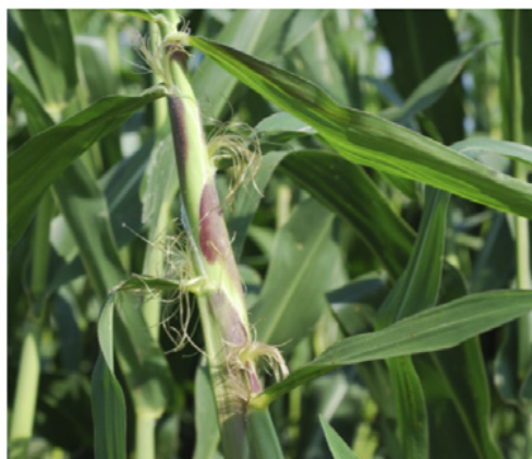
Emergencia de los estigmas ("sedas"). Estadio 63.