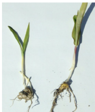
Plántulas de teosinte y de maíz en los estadios 09 a 12.