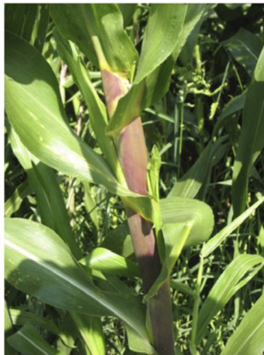
Inicio de dos ramificaciones laterales. Estadio 62.2.