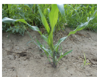
Planta de teosinte con un hijuelo. Estadio 21.